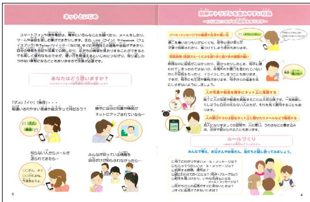
小学校向けに作成した SNS 啓発パンフレットの内容

提言理由でも述べたとおり、近年、いじめに SNS が利用されるケースが増えていることは、本市に限らず大きな問題となっており、各自治体や学校でも、対応に苦慮されているのが現状である。この点について、委員会で調査・研究した中では、視覚に訴えるような内容で、保護者のみならず、児童生徒でも、SNS の正しい使い方などが理解しやすいように工夫されたパンフレットを作成し、啓発活動を行っていた自治体があり、印象に残ったところである。本市においても、平成23年度に携帯電話に関する啓発パンフレットを作成した経過はあるが、「SNS によるいじめ」は、近年問題視されるようになったことから、その啓発パンフレットは作成されていないのが現状である。したがって、SNS によるいじめやトラブル発生の現状を鑑み、啓発パンフレットを作成するなど、啓発活動を充実していただきたいと考える。また、併せて啓発活動についても、さらなる強化を実施していただきたい。内容としては、タウンミーティング等の実施により、児童生徒とそれ以外の方が議論する場を設けることや、スマートフォンや携帯電話・SNS にかかるトラブル事例をまとめた DVD を視聴することといった、一般的とも言えるものでも、継続して実施することが重要であると考え。ついでには、今後も一層の啓発に努めていただきたい。